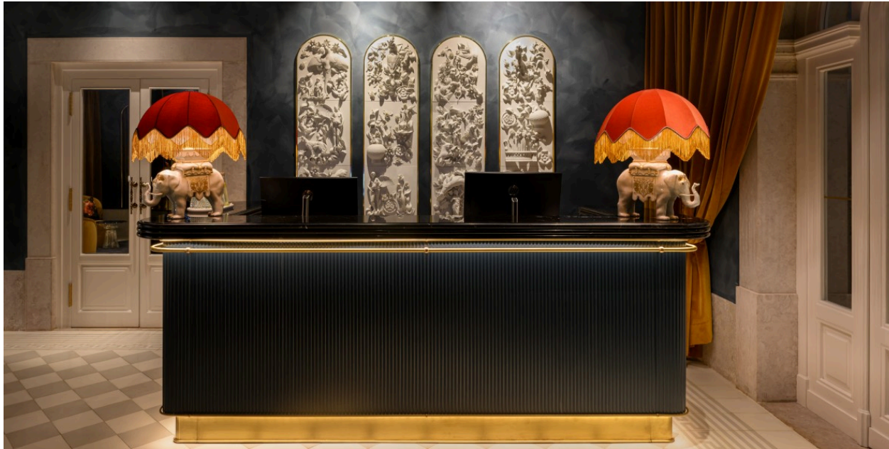
Grupo Montebelo Hotels &amp; Resorts

Já os quartos com vista para o Largo do Barão de Quintela distinguem-se pela presença de elementos em porcelana biscuit da Vista Alegre.