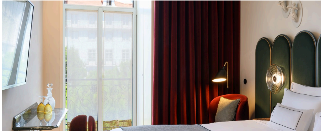
Grupo Montebelo Hotels & Resorts