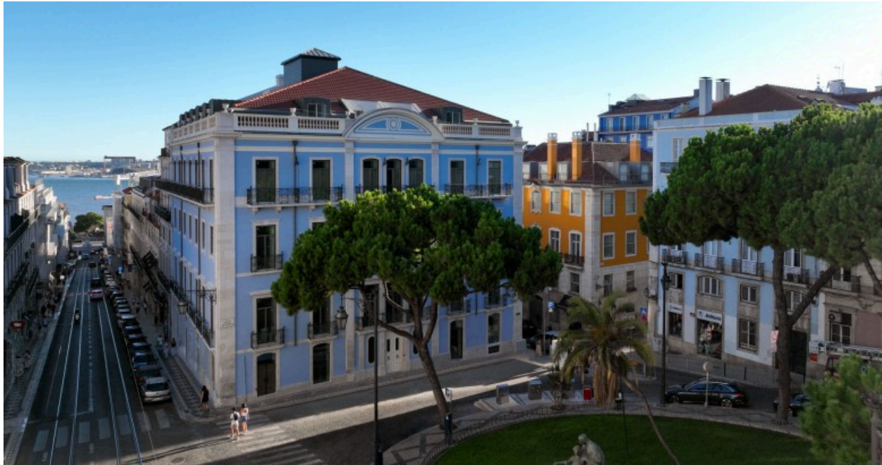
Montebelo Vista Alegre Lisboa Chiado Hotel / Grupo Montebelo Hotels &amp; Resorts