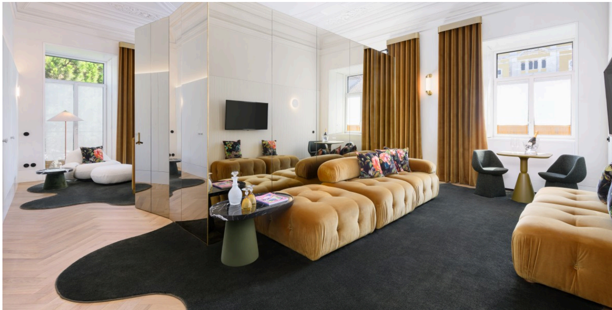
Grupo Montebelo Hotels &amp; Resorts

Os motivos mudam consoante a rua para onde o quarto se abre. Nos quartos virados para a Rua das Flores , predominam motivos florais , num diálogo direto com o nome da rua. Nos quartos que se abrem para a Rua do Alecrim , surgem referências ao alecrim mediterrânico , em traços elegantes e subtis.