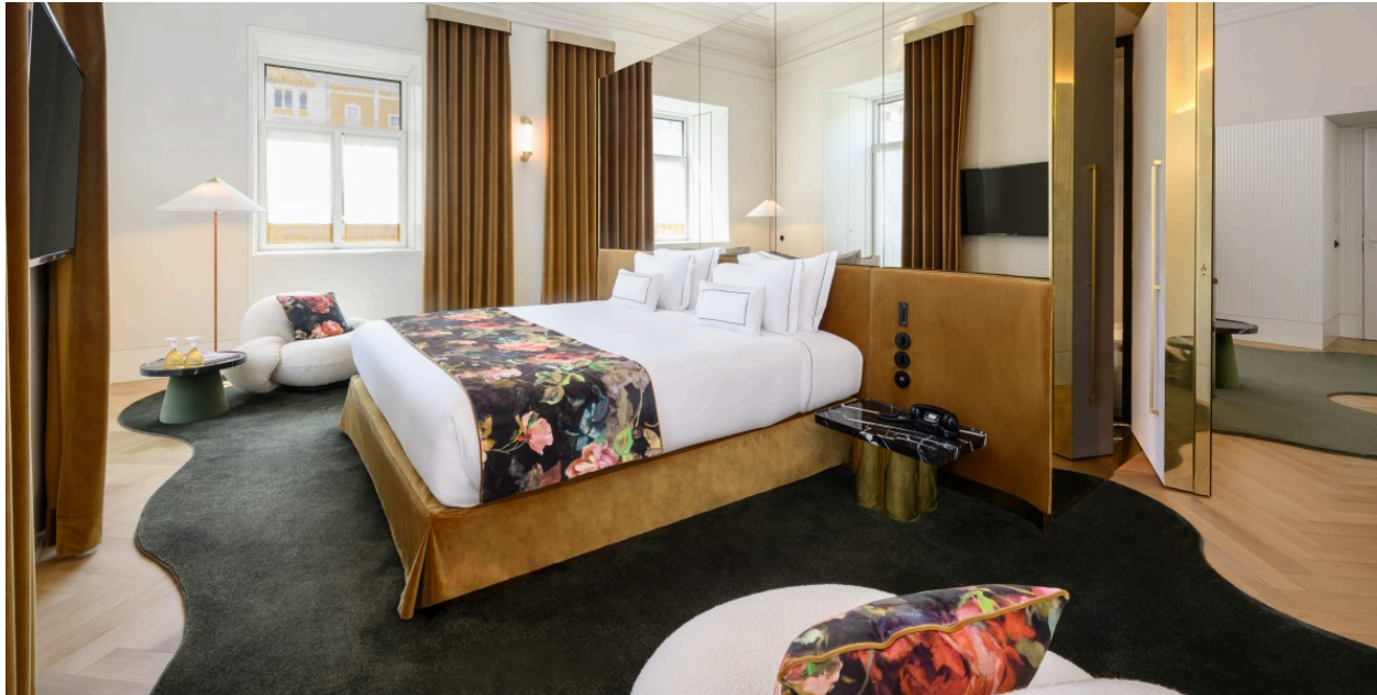
Grupo Montebelo Hotels &amp; Resorts

Os pormenores decorativos são um dos elementos mais distintivos deste hotel com encanto. Muitos foram pintados à mão por artistas da Vista Alegre , transformando cabeceiras, painéis e apontamentos em verdadeiras peças de arte aplicadas.