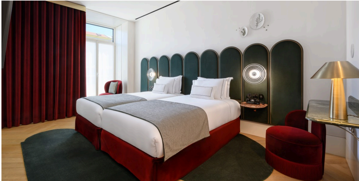
Montebelo Vista Alegre Lisboa Chiado Hotel / Grupo Montebelo Hotels & Resorts

Da entrada aos corredores, percebe-se a intenção: este não é apenas um sítio para dormir, é um lugar para estar em Lisboa com sentido de lugar. Um “endereço” que poderia pertencer a um lisboeta atento à estética – e que agora se abre a quem chega de fora.